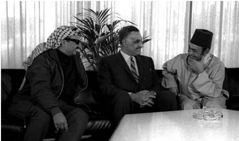
عبد الناصر مع الملك الحسن وياسر عرفات أثناء مؤتمر القمة العربي الخامس في الرباط ١٩٦٩/١٢/٢٠